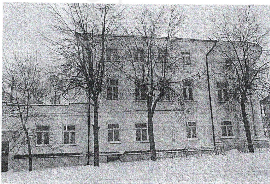
Фото 2. Вид со стороны улицы Крестьянской (восточный фасад)