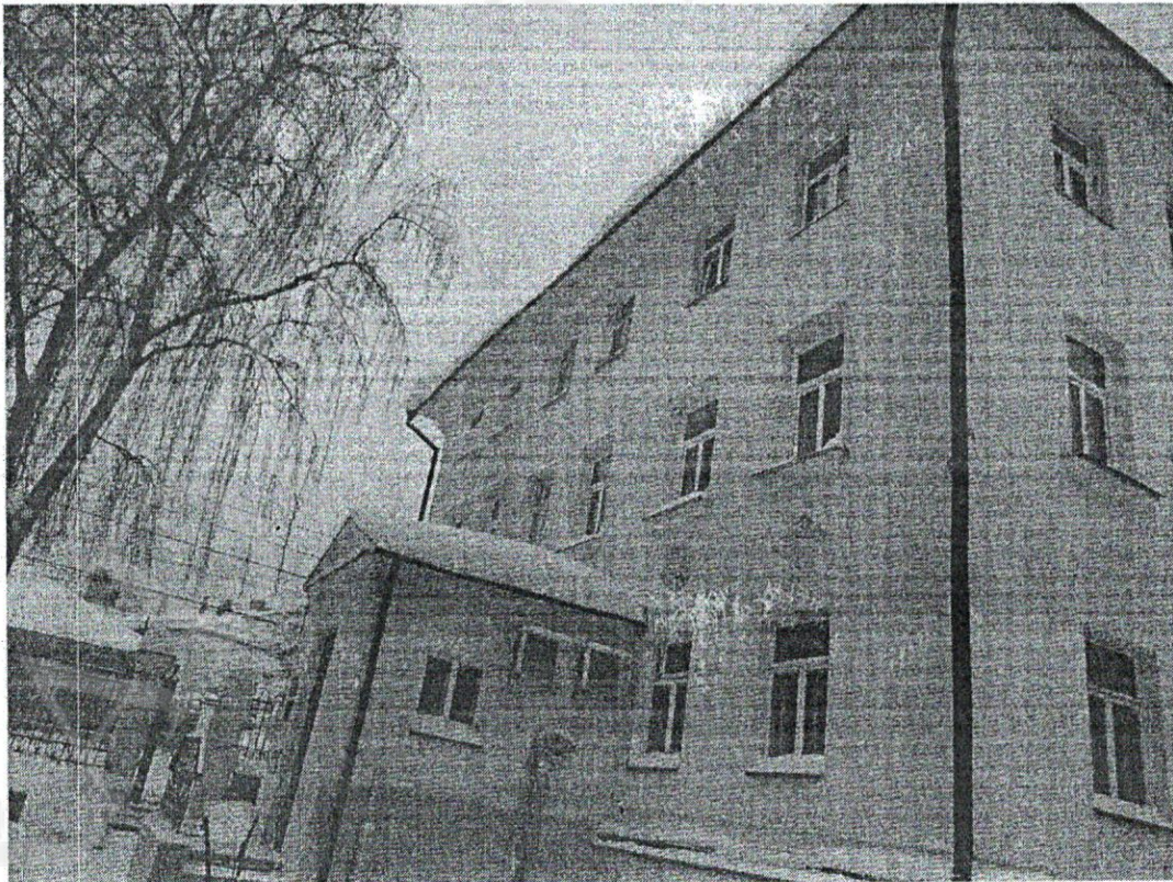
Фото 4 Боковой (западный) фасад