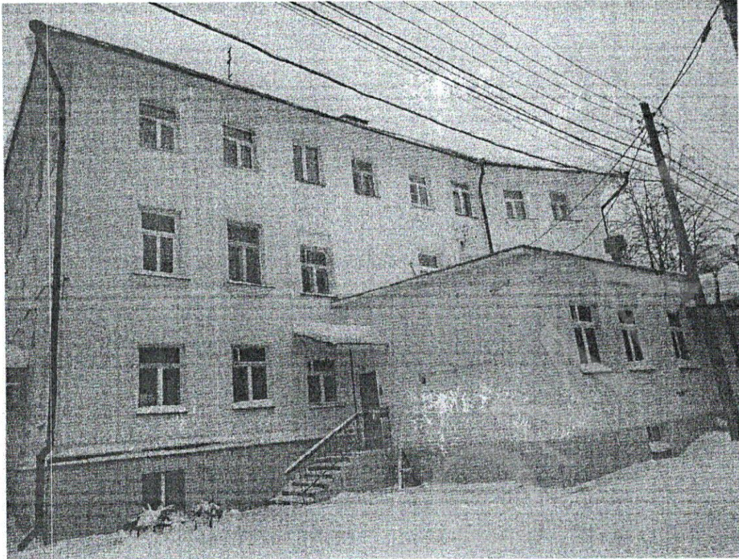
Фото 3 Дворовый (южный) фасад